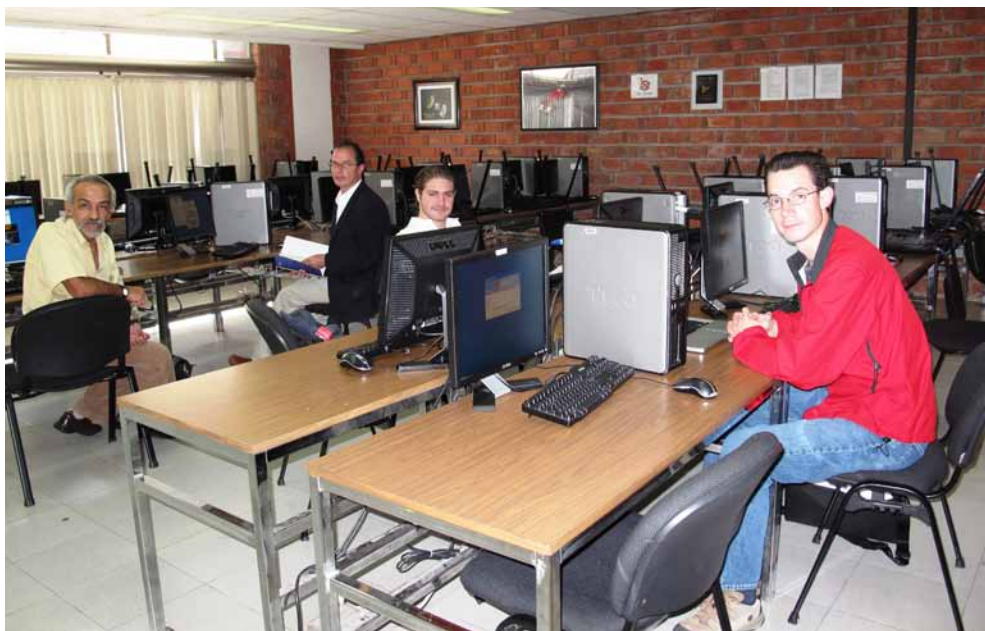
Asistentes al curso