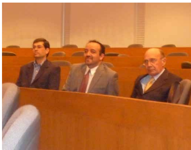
Asistentes al evento Espacio Biomédico