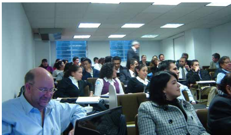
Asistentes al evento de TI