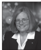
Catherine T. Hunt

■ El Departamento de Ingeniería y Ciencias Químicas, a través del Centro Mexicano de Química en Microescala, fue sede del Instituto Pan-Americano de Estudios Avanzados sobre Sustentabilidad y Química Verde 2007 (PASI) , por su sigla en inglés), patrocinado por la American Chemical Society (ACS) y la National Science Foundation de los Estados Unidos. El PASI se llevó a cabo del 30 de mayo al 9 de junio, con la presencia de 80 profesores y estudiantes de posdoctorado o de posgrado provenientes de 8 países de América, 4 de Europa, 2 de Asia y 1 de Oceanía. El curso cubrió interesantes aspectos del tema objeto de su título, que estuvieron a cargo de reconocidos especialistas como la Dra. Catherine T. Hunt , presidenta de la ACS, y el Dr. Paul T. Anastas , de Yale University (y anterior director del Green Chemistry Institute-ACS), entre otros. El PASI sin duda proyecta la imagen de la UIA como una institución reconocida internacionalmente —con un interés claro en el mejoramiento del ambiente— además de relacionarnos muy de cerca con la organización que agrupa al mayor número de profesionales de la química y la ingeniería química en el mundo, la cual goza de una gran influencia. Esta colaboración se dio debido a que en la UIA reside el Capítulo Mexicano del Green Chemistry Institute de la ACS.